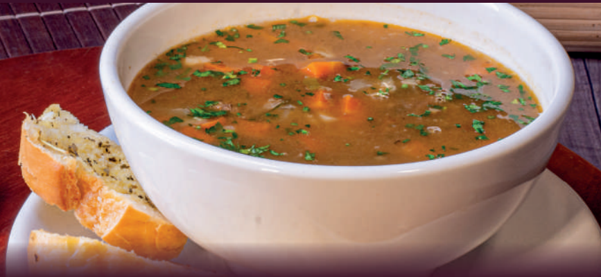
IMAGEM: Sopa do dia