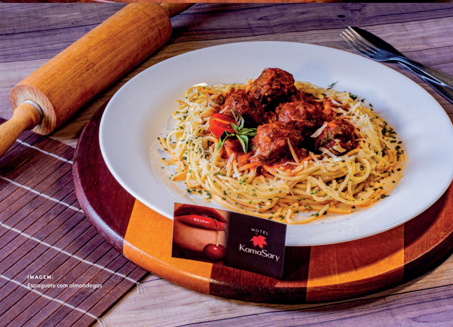
IMAGEM: Espaguete com almondegas