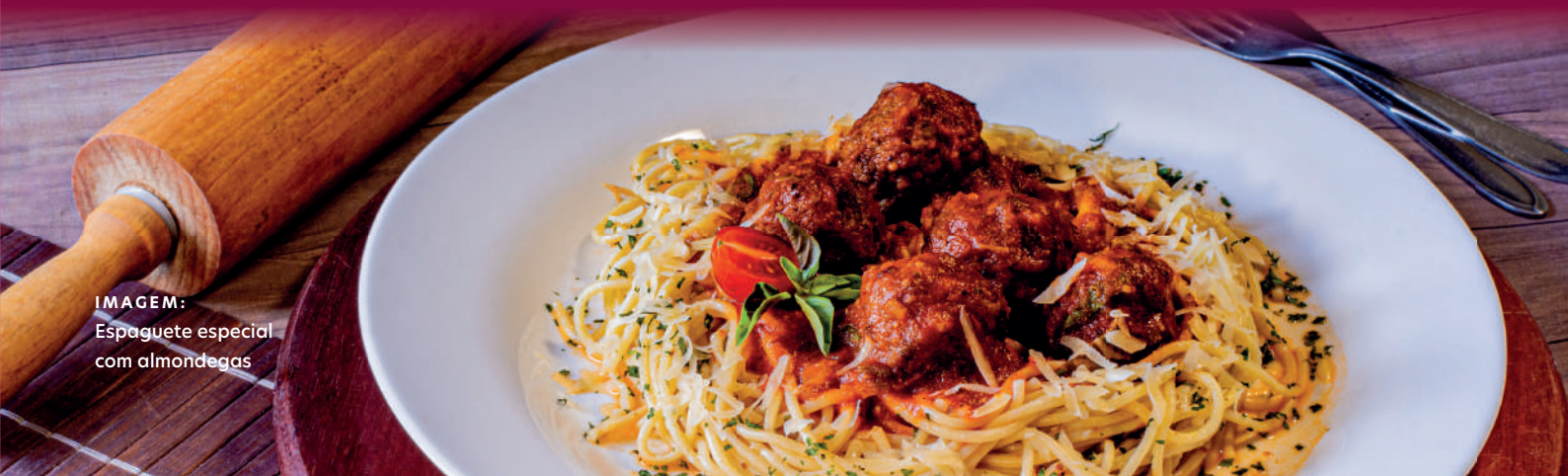
IMAGEM: Espaguete especial com almondegas

OVO FRITO OU COZIDO (UNID.) ..... R$ 2,50