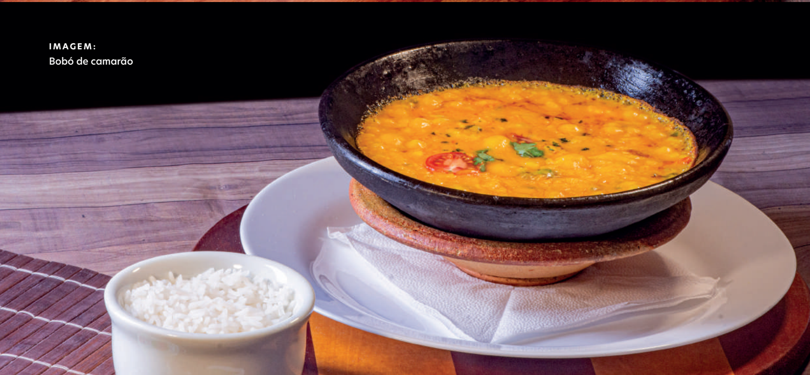
IMAGEM: Bobó de camarão