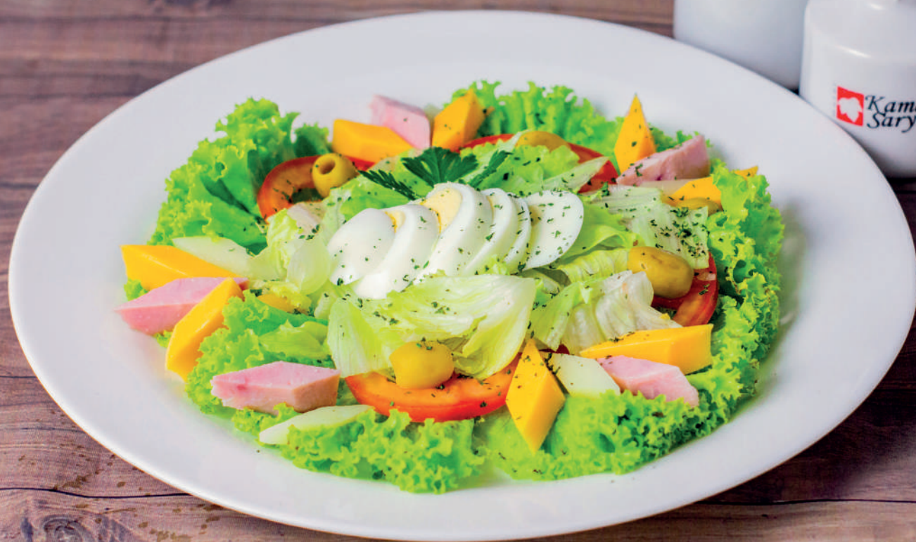
IMAGEM: Salada do chefe