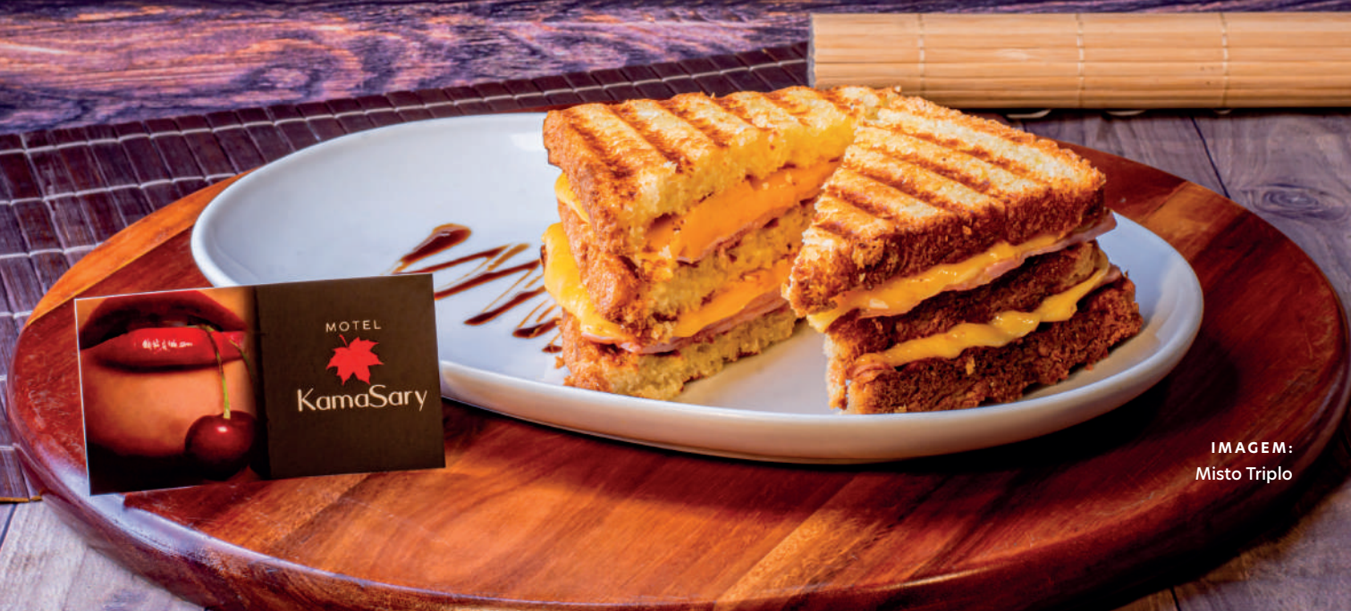
IMAGEM: Misto Triplo