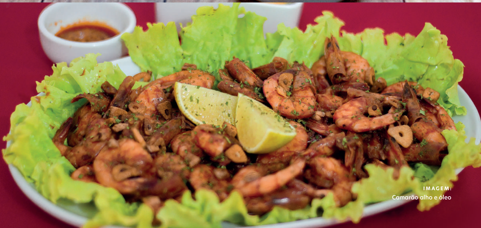
IMAGEM: Camarão alho e óleo