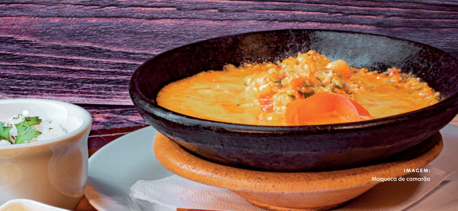
IMAGEM: Moqueca de camarão