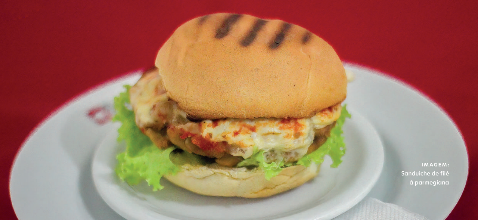
IMAGEM: Sanduiche de filé à parmegiana