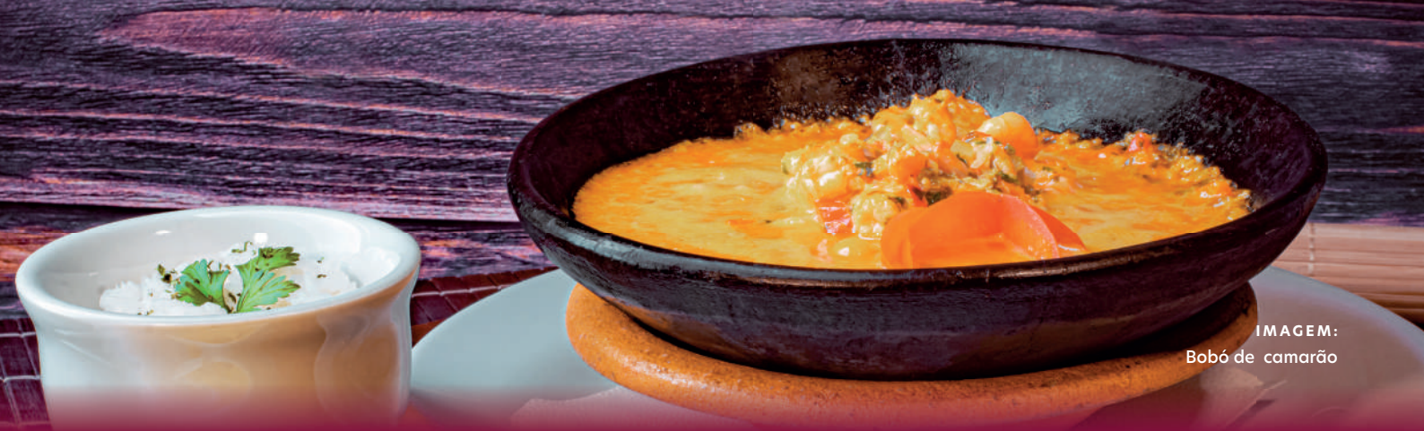
IMAGEM: Bobó de camarão