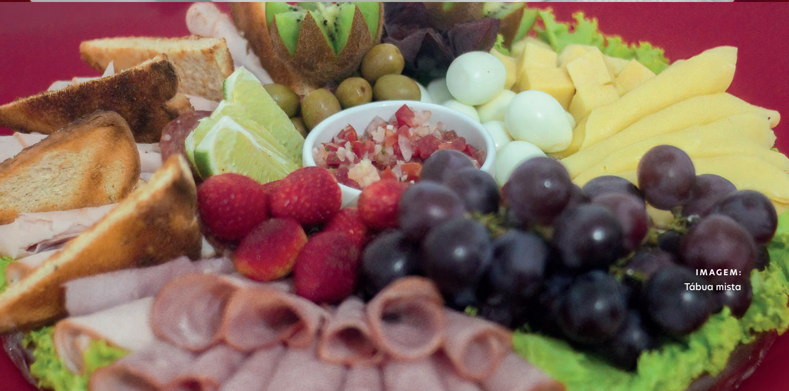
IMAGEM: Tábua mista