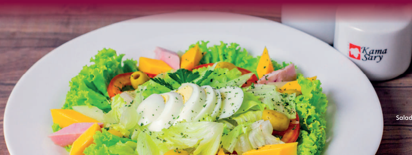
IMAGEM: Salada do Chefe

(Canja de galinha, Legumes com Carne ou Frango, ou Cappelletti com Frango).