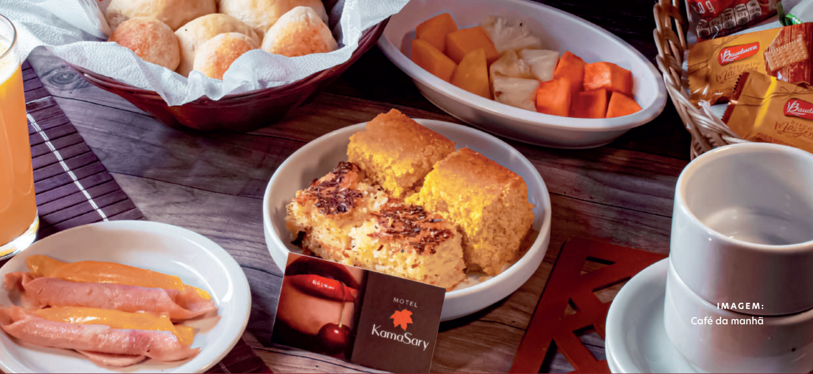
IMAGEM: Café da manhã