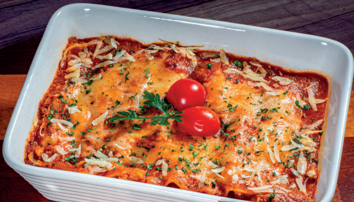
IMAGEM: Lasanha ao forno