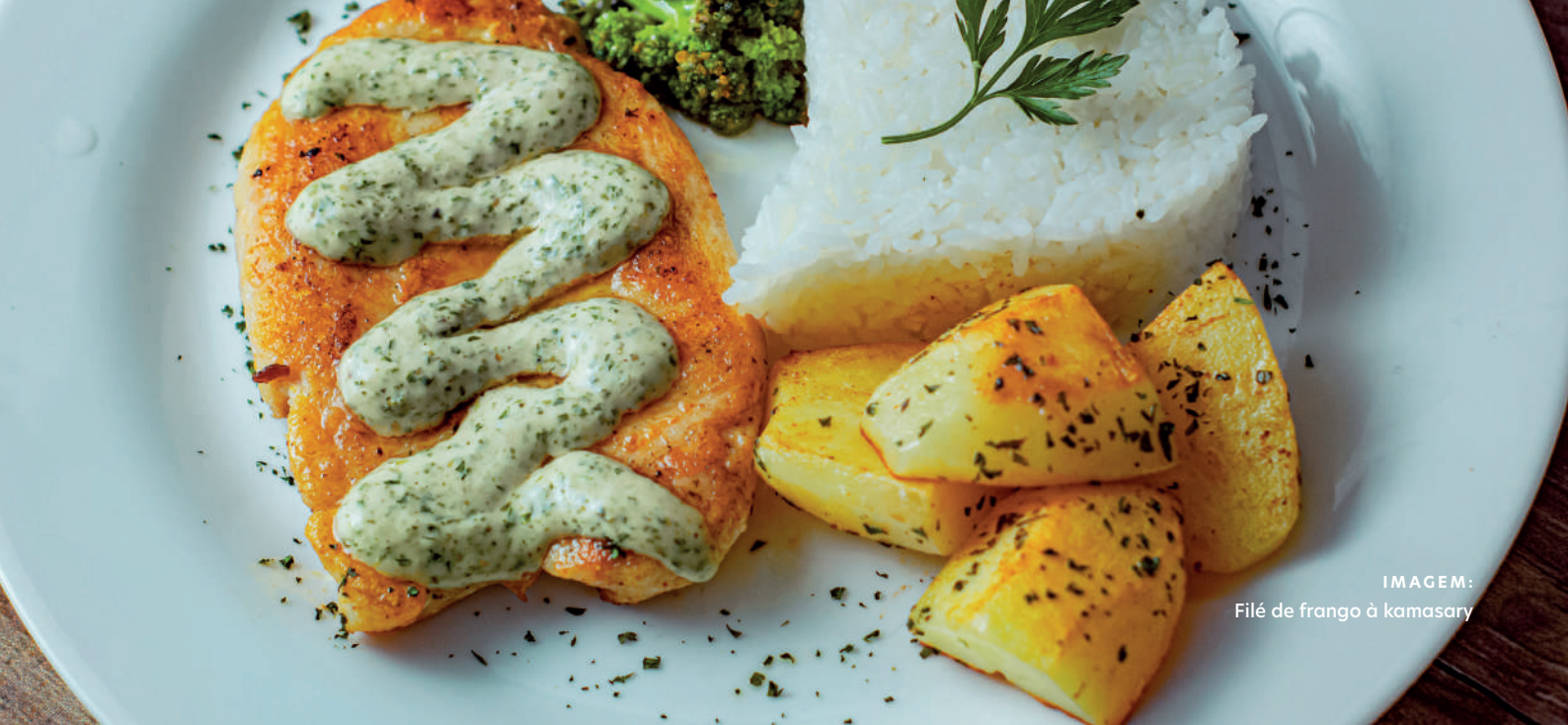
IMAGEM: Filé de frango à kamasary