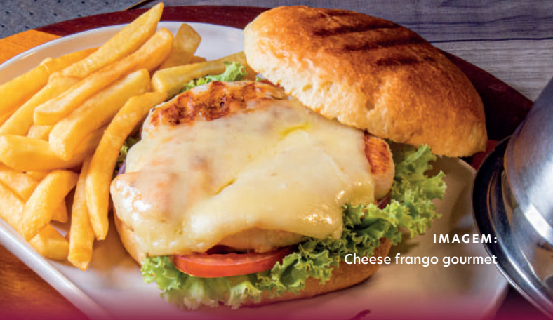
IMAGEM: Cheese frango gourmet