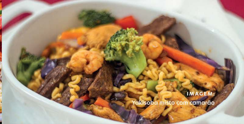
IMAGEM: Yakisoba misto com camarão