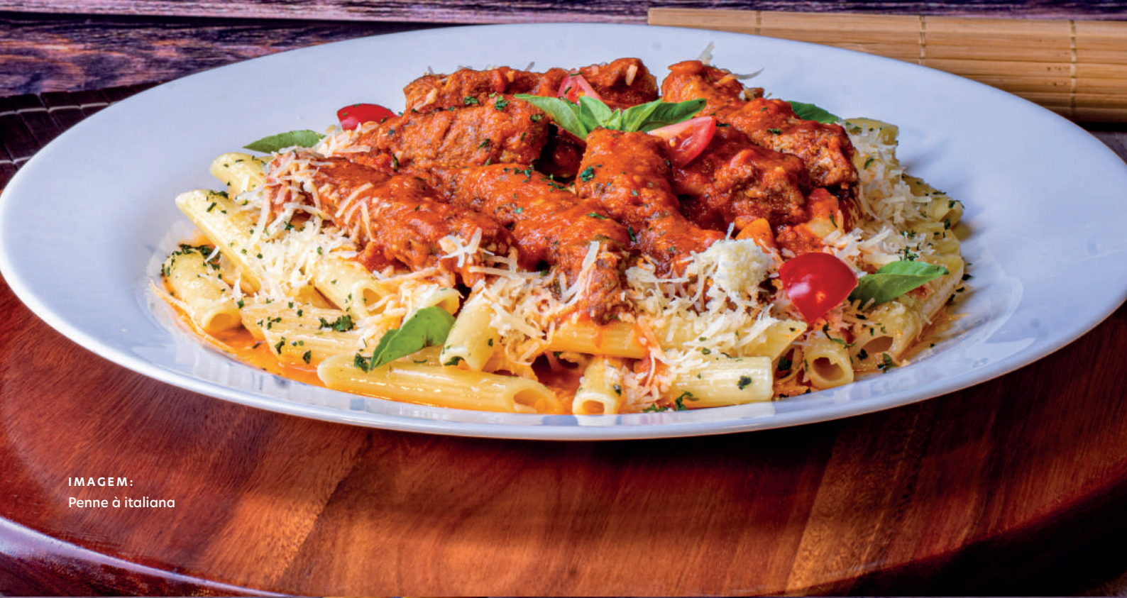
IMAGEM: Penne à italiana