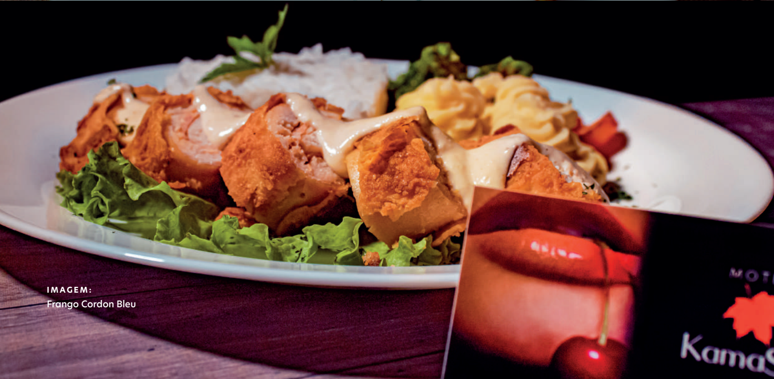
IMAGEM: Frango Cordon Bleu