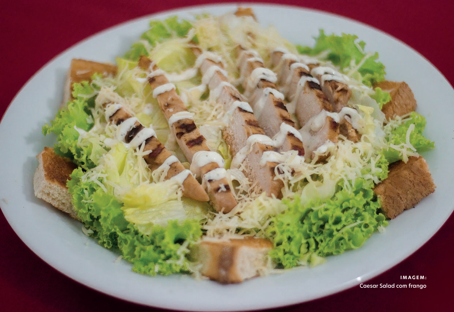
IMAGEM: Caesar Salad com frango