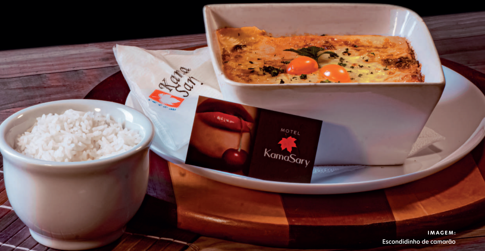
IMAGEM: Escondidinho de camarão