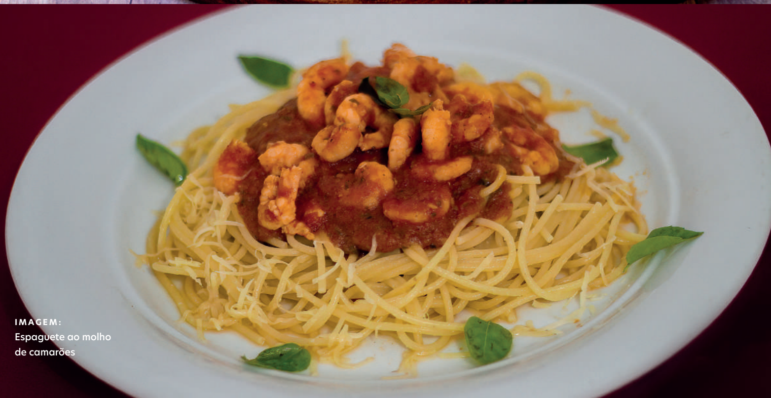
IMAGEM: Espaguete ao molho de camarões