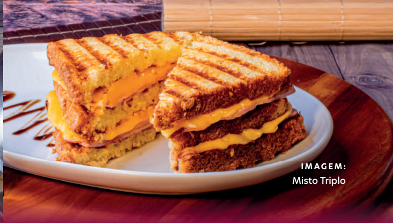
IMAGEM: Misto Triplo