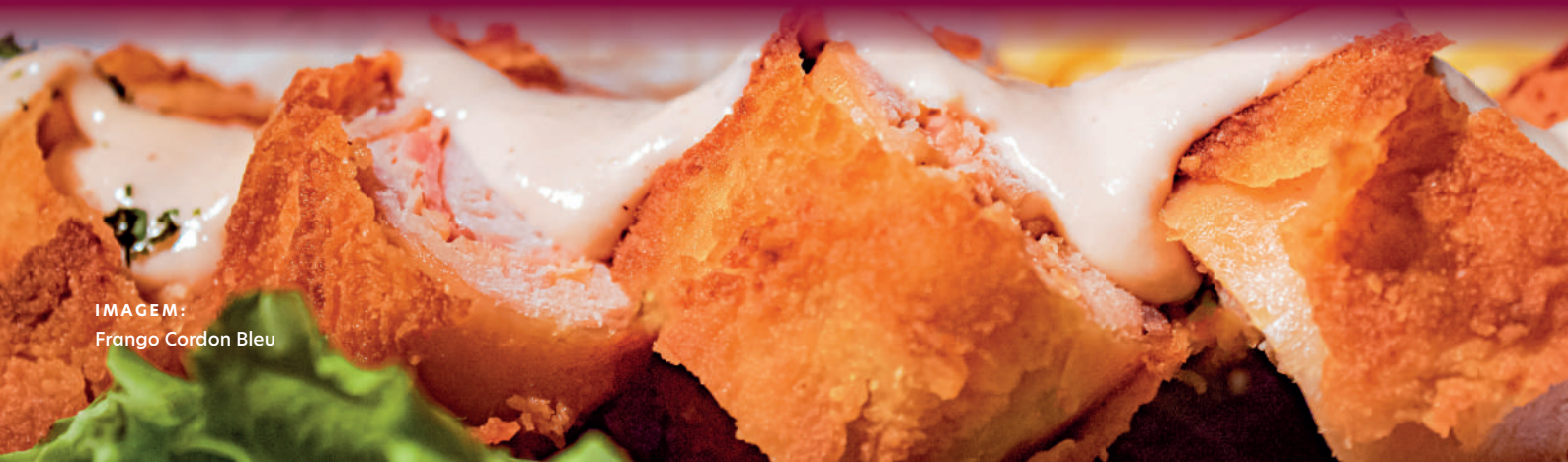
IMAGEM: Frango Cordon Bleu

(Peito de frango empanado, recheado com queijo e presunto, molho branco, brócolis grelhados, servido com purê de batata e arroz)