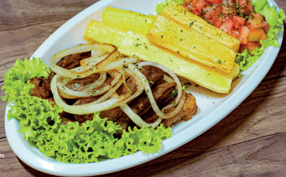
IMAGEM: Picanha à palito