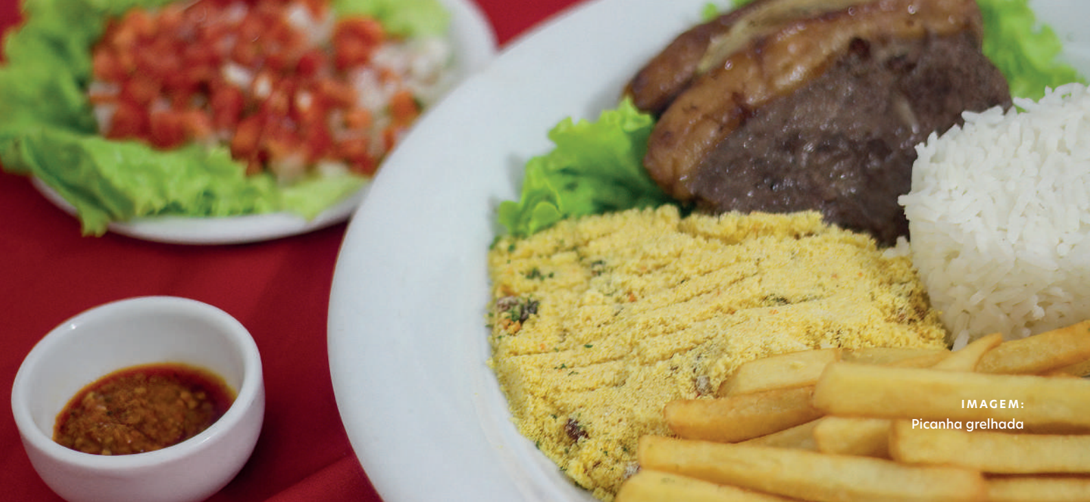
IMAGEM: Picanha grelhada