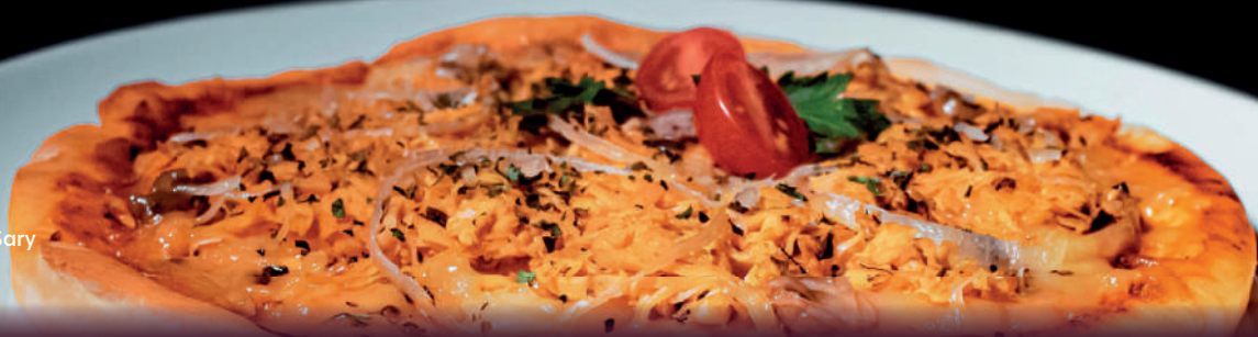
IMAGEM: Pizza KamaSary