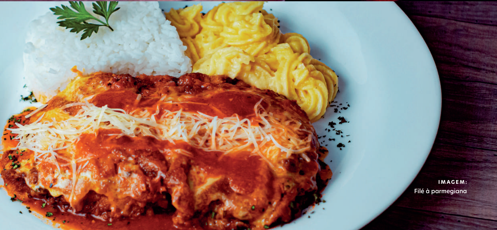
IMAGEM: Filé à parmegiana