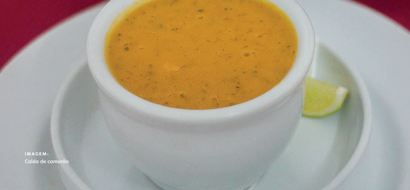
IMAGEM: Caldo de camarão