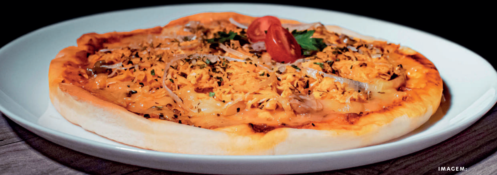
IMAGEM: Pizza KamaSary