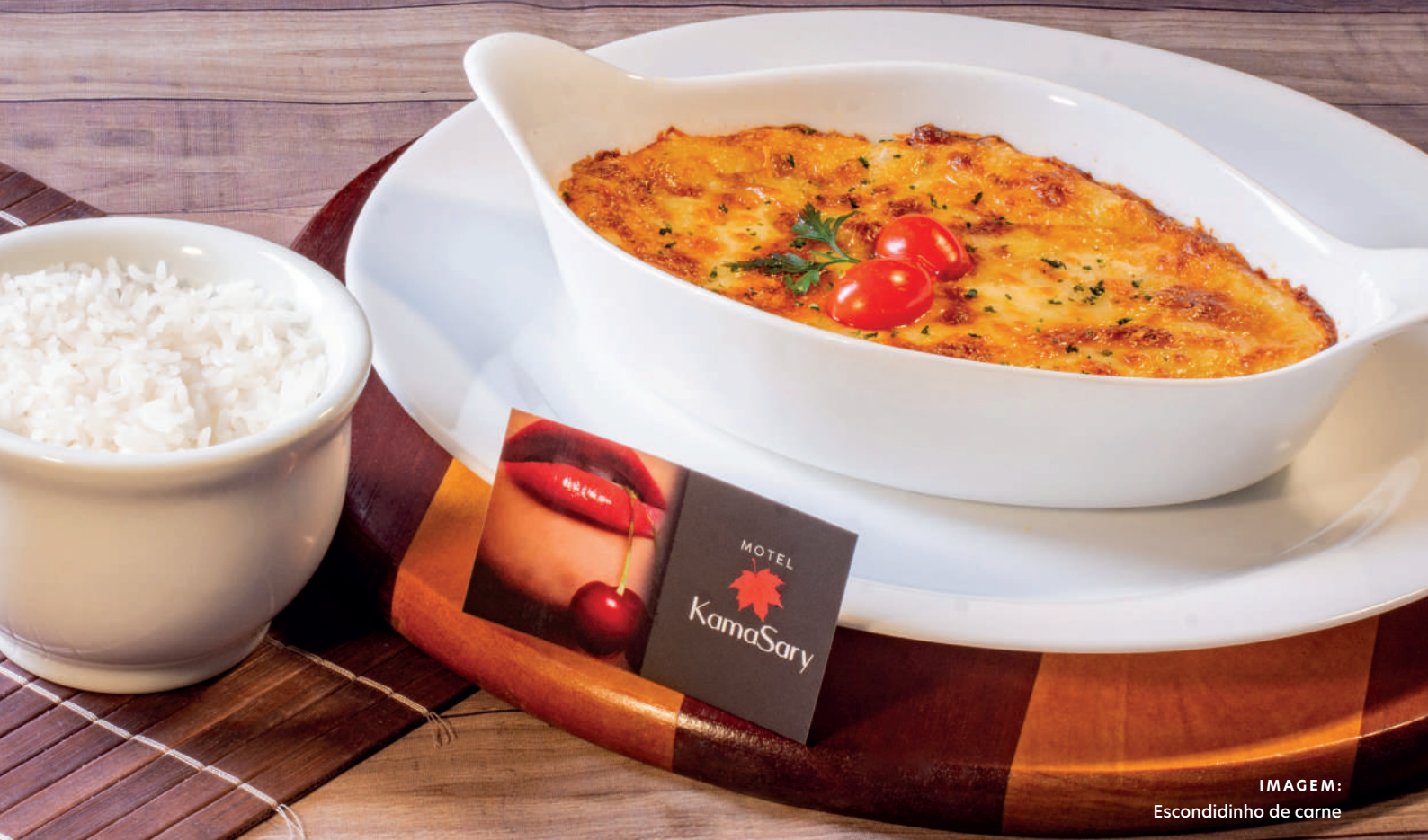
IMAGEM: Escondidinho de carne