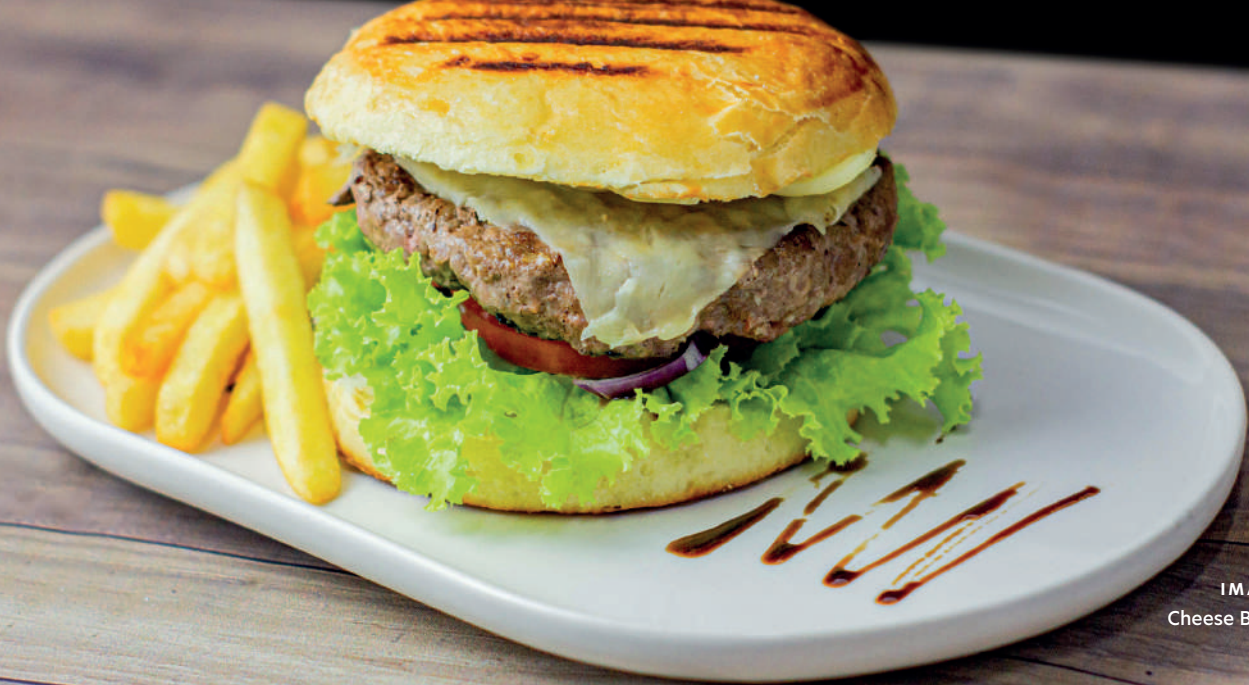
IMAGEM: Cheese Burger