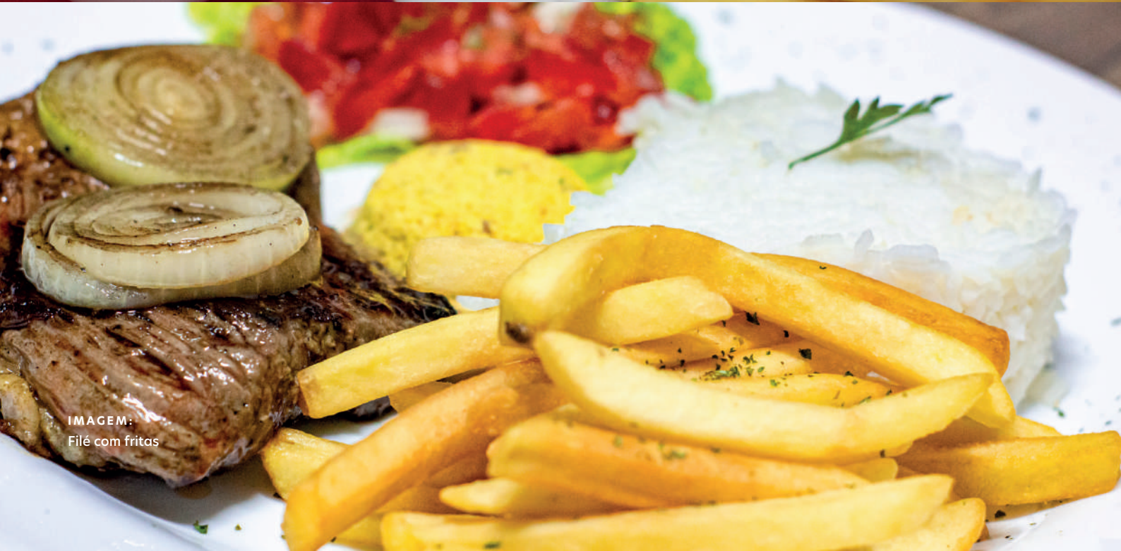
IMAGEM: Filé com fritas