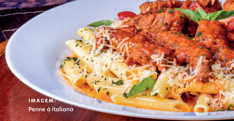
IMAGEM: Penne à italiana