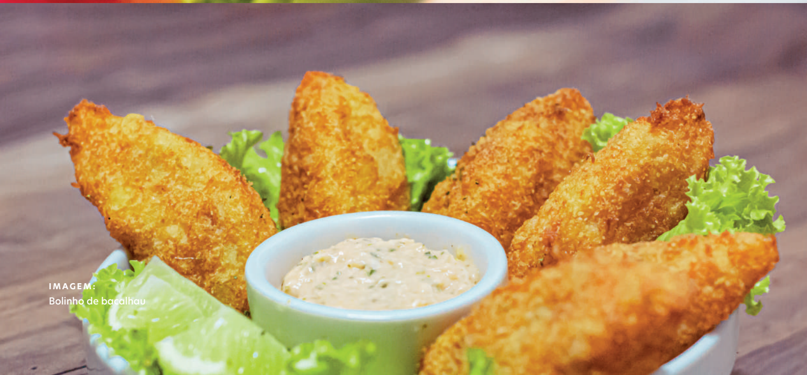
IMAGEM: Bolinho de bacalhau