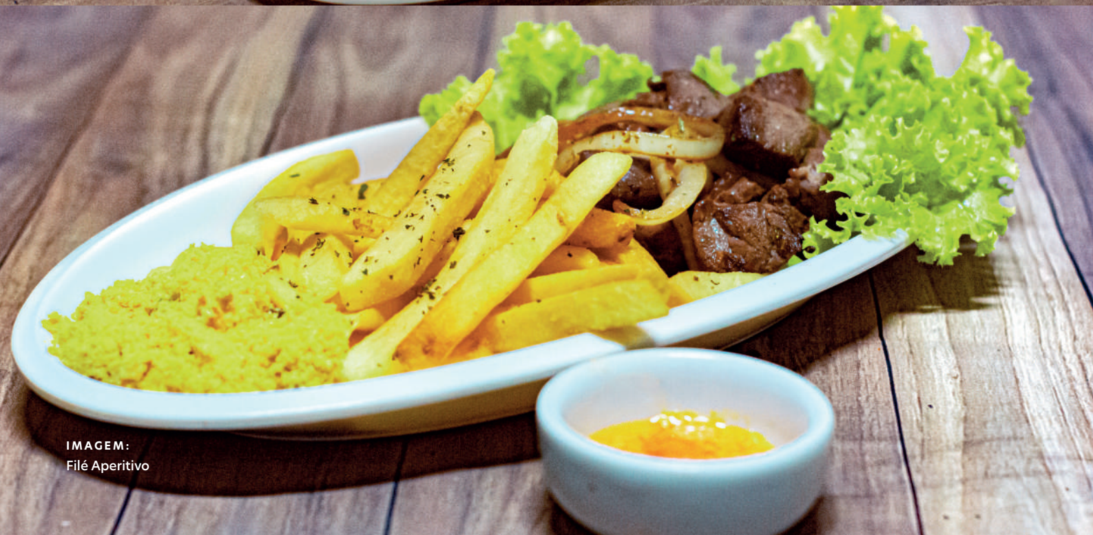
IMAGEM: Filé Aperitivo