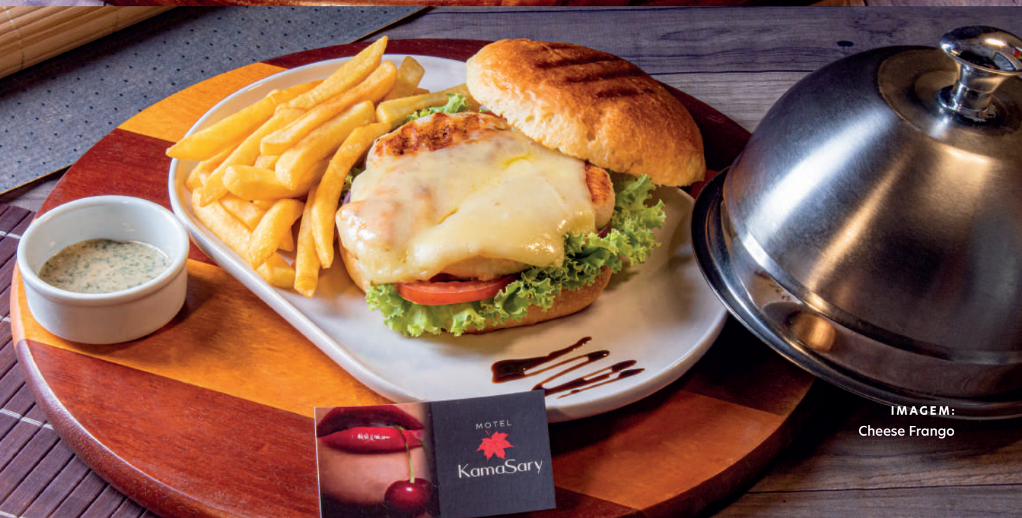
IMAGEM: Cheese Frango