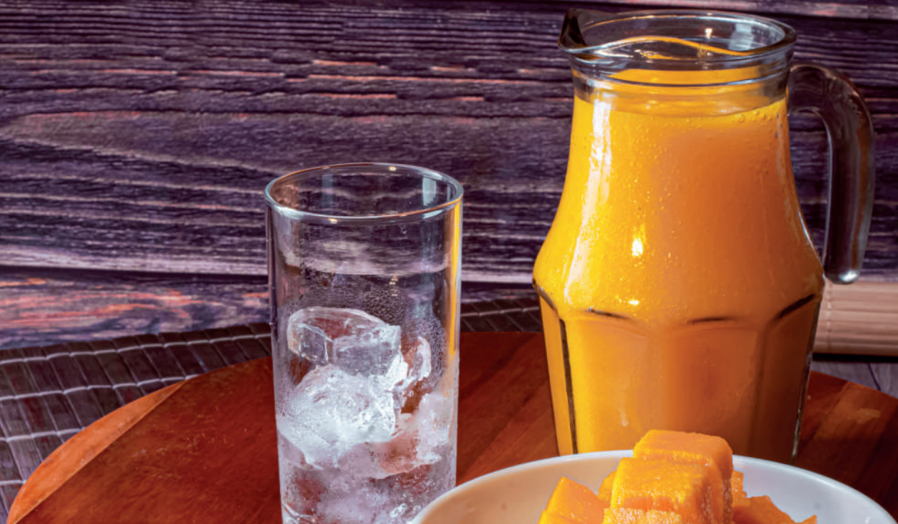
IMAGEM: Suco natural