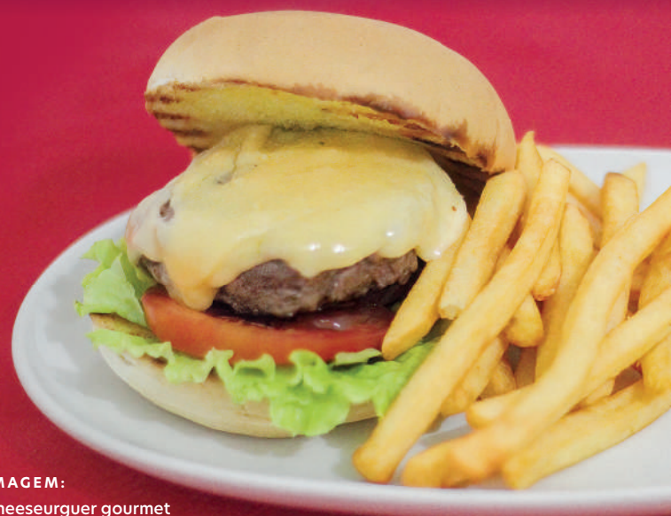
IMAGEM: Cheeseurger gourmet