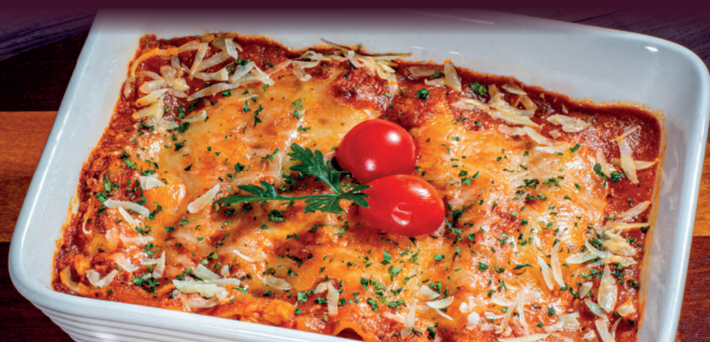
IMAGEM: Lasanha ao forno