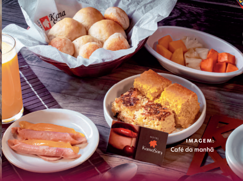
IMAGEM: Café da manhã