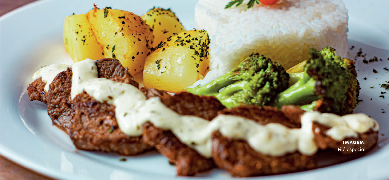
IMAGEM: Filé especial